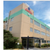
本社は水郷の町として有名な福岡県柳川市に構える